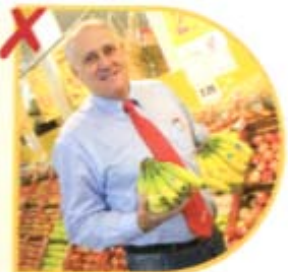
Otto May Rewe-Supermarkt

Natürlich brauchen wir diese Innovation: Für unsere Gäste, für die Einheimischen, um den Winter zu beleben, um im Sommer Schlechtwetterperioden zu überbrücken, um uns von anderen Mitbewerbern wie z.B. Rudesheim abzuheben, um eine neue Gästeklientel für Boppard zu gewinnen als Ersatz zum wegbrechenden Kegelclubgeschäft.