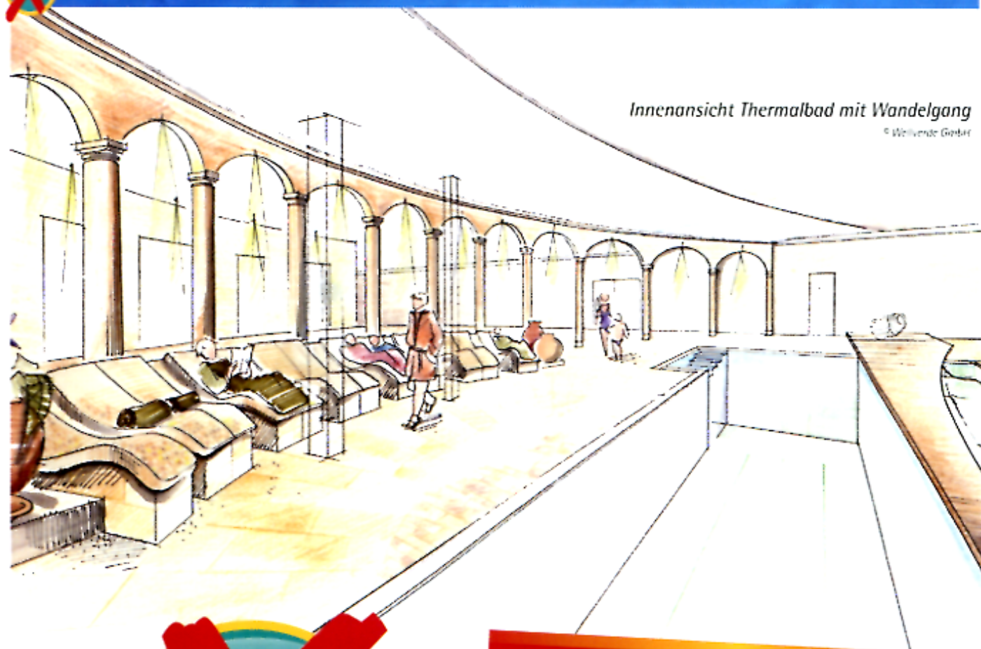
Innenansicht Thermalbad mit Wandelgang