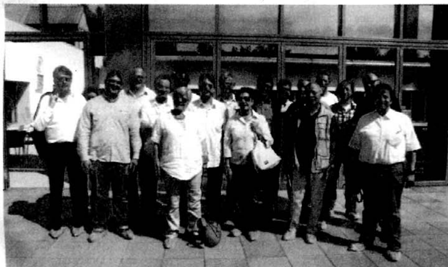
Viel ehrenamtliche Zeit hat die Findungskommission aus Bopparder Stadträten investiert, um neue Schwimmbad-Ideen nach Boppard zu holen. Auf dem Foto bei einem Besuch in Neuss im Mai dieses Jahres. Das Ergebnis der Aktivitäten wurde letzten Montag im Stadtrat vorgestellt und hat durchaus Respekt verdient.

Nun folgen neue Gespräche mit Kreisverwaltung und Ministerium, bei denen Bürgermeister Dr. Bersch die Fraktionvorsitzenden mit einbeziehen will. Dabei wird nun die Realisierbarkeit des neuen Kompromisses "Cabrio-Bad" geklärt werden. "Rund um Boppard" wird berichten.